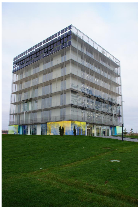
5. Hypercube (3)

Die transparente Drahtgewebeverkleidung aus dem Architekturgewebe EGLA-MONO 4961 lässt durch seine offene Fläche von 73 % genügend Licht in die Innenräume.