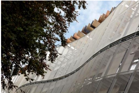
4. _MG_7477 1.jpg

Geschwungener Drahtgewebivorhang aus 2.200 m 2 Architekturgewebe von Haver & Boecker.