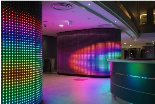
2. Al Sadd Sports Hall (11)_b.jpg

Besonderer Blickfang im Zentrum des Haupteingangsbereichs der Multifunktionsarena des Al Sadd Sport Clubs in Doha sind zwei verkleidete Säulen mit Architekturgewebe.