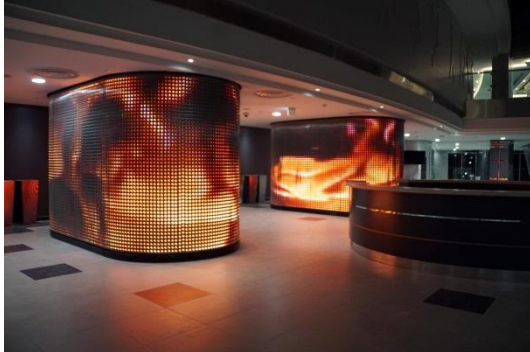
1. Al Sadd Sports Hall (15)_b.jpg

Besonderer Blickfang im Zentrum des Haupteingangsbereichs der Multifunktionsarena des Al Sadd Sport Clubs in Doha sind zwei verkleidete Säulen mit Architekturgewebe.